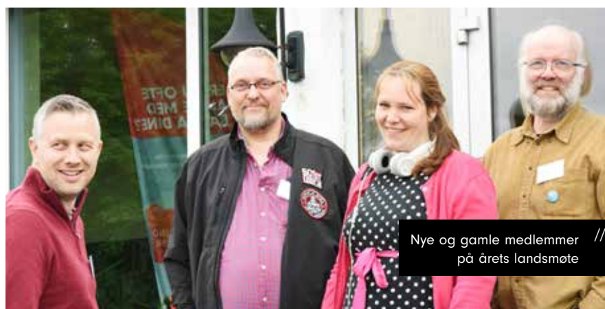
Nye og gamle medlemmer // på årets landsmøte

Viktigere enn kontingenten var arbeidsplanen som ble vedtatt. Den er ambisiøs for å følge opp den positive trenden organisasjonen er i. En rød tråd gjennom planen er økt satsning på medlemmer og frivillige. For å ta imot mennesker som ønsker å gjøre en frivillig innsats, og for å være synlige i lokal-