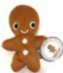
Kosepeppe kr. 150,-