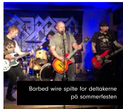
Barbed wire spilte for deltakerne // på sommerfesten

Hele arrangementet var støttet av IOGT-avdelinger på Østlandet; og Rørbakk er klar til ny fest neste år. – Jeg jobber