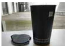
IOGT-koppen kr. 150,-