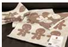
Koppåndkle kr. 150,-