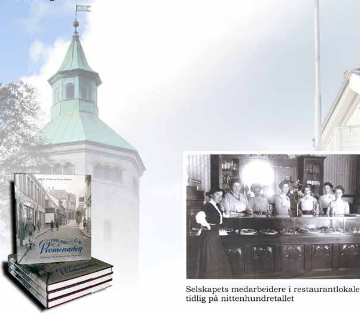
Selskapets medarbeidere i restaurantlokalet tidlig på nittenhundretallet

Selskapet har gitt ut flere bøker om avholdsbevegelsens virksomhet i Stavanger.