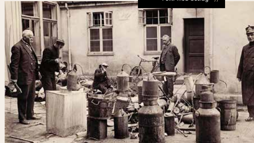
Politi med beslag //

Det hadde vært en sterk økning i drukkenskapsforseelser i krigsårene, (arrestasjoner eller bøtelegging på grunn av offentlig beruselse) Et forbud mot produksjon og salg av norskprodusert øl og brennevin var alt vedtatt i 1914 for å sikre at korn og poteter ble spist, og ikke drukket. I mai 1917 vedtok regjeringen et ytterligere forbud mot å importere selv og skjenke drikke med mer enn 15 prosent alkohol.